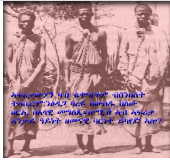
ኣፍሪቃውያን ካብ ቁቀኸተም ብሰንሰለት ተኣሰሮም፡ ንዕዳጋ ባሪዩ ከውበዱ ከለው ዘርኢ ስእላዊ መግለጺ። ሎሚኸ ኣብ ኣፍሪቃ ኣንታይ ዓይነት ዘመናዊ ባርነት ይካየድ ኣሎ?

አብቲ መዋእል'ቲ ሕብረተ-ሰብ ኣፍሪቃ ኣብ ክንዲ ስርዓተ ትምህርትን ጉርሕን፡ ግርህነትን ፈሪሃ-እግዜእቢሔርን ጥራይ ዝዓብለሎ'ዩ ነይሩ። ብዙሓት ሸፋቱ በብእዋኑ ነቶም ካብእም ንላዕሊ፡ ስቡሕ መሬትን ሃብትን ጥሪትን ዝነበሮም፡ እንዳወረሩ ክዘምትዎም ኩናት ይውልዑ ነበሩ። ብኸምዚ ከኣ ኣብ መንገዱ ዝተፋላለያ ዓድታትን ዓሌታትን ኩናት ሓድሕድ ዝውቱር ነበረ። እቶም ዝውረሩ ዝነበሩ ድማ ሃብቶምን መሬቶምን፡ ጥሪቶምን ንኸከላኸሉ፡ ንዝወርም ይምክቱዎ ነበሩ። ብኸምዚ ከኣ እቶም ዝሓየሉ፡ ነቶም ዝሓመቹ ማሪኾም ይኣስሩዎም ነበሩ። ከም ባሪዩ ገይሮም የሸቅሉዎምን ይሸጡዎምን ከኣ ነበሩ። ንኣብነት ኣብቲ ፈለግ እዋንቲ ኣዕራብ-ነጋዶ ንምዕራብ ኣፍሪቃ እንዳሰሎኹ፡ ወርቅን ስኒ-ሓርማዝን ቁርባት-ነብርን፡ ካልእ ክቡር ንብረትን ዓዲጎም ዝመላልሱሉ እዋን ስለዝነበረ፡ ሰብ ዓዲግካ ምስትሸይጥን ትልወጥን ዝያዳ መኸሰብ ከምዝርከብ ደፋኢ ኣንዳበሉ ክፈልጡ ስለ ዝጀመሩ፡ ነቶም ሓያላት መራሕቲ ዓድታት ኣፍሪቃ፡ ካብቶም ዝማረኹዎም ደቂ ሃገር ሰለይ እንዳበሉ ንኸሸጡሎም ኣለማመዱዎም። ካብኡ ቀጺሎም እቶም ነጋዶ ኣዕራብ፡ ነቶም ከም ኣቕሓ ተቈጺሮም፡ ብስም ባሪዩ ካብ ኣፍሪቃ ዝተዓደጉ ኣፍሪቃውያን፡ ብዙሕ መኸሰብ ንኸረኽቡ ንሃገራት ኣዕራብን፡ ንሃገር ስፓኛን ግልያታት ኮይኖም ንኸገልግሉ ክሸጡዎም ጀመሩ።