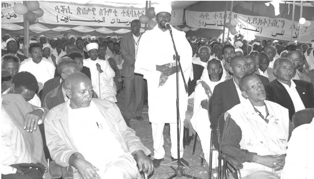
ድባርዋ!! ሰላማዊ ሰልፍስ፡ አብ ጽርጊያታት ወጻእካዮ። አብ ውሽጢ ኾንካ ድኣ ዘይናቲ!!

እቶም ኣዳለውቲ ከምዚ አብ ታሕቲ ትርእይዎ ዘለኹም ሰእለ፡ ዘሎ ታባቤታት ቀረቡ። አብ መናድቕ ተለጠፉ ንፋስ ገፊዑ ንግዳም ከይወስደሎም፡ ሓዞ ሓዞ ኮይኑ ከኣ ብሃንደበት አብ ዘይተሓሰበ ሰላማዊ ሰልፍን እምባጋርን ንክቕየር ምክንያት ከይኮኖ፡ ብመሳምር ዳደሺ ነቕ ንክይብል ከም ዝርቃዕ ገበርዎ። እቲ ዳስ ብድምጺ ዓቕሉኳ እንተጸበቡ፡ በዝን በትን ነኳል ረኺበ ኣለኹ ብማለት፡ ንመሰል ህዝቢ ዝጠበቐ ውልዶ ጭርሖታት፡ ከም ኣጋጣሚ ኾይኑ እግሪ ኣውጺኦም ብምፍንጣስ ንጽርግያ ክወጹ ከይፍትኑ፡ ኣይፋልኩምን ደገ ምውጻእ ነውሪ!! በልዎም። ስምዑ!! ቀለል ምህዞ ምሂዝናልኩም ኣሎና። እቲ ጥርዓንኩም ከተቕርብሉ እትደልይዎ መራሕ ኣብዚኣ ሕጂ ጥብ ከነብልልኩምና ብማለት፡ ኣተሃዳዲኦም ኣጸበይዎም። ደጋጊሞም ከኣ፡ ጽርጊያ ወጻእካ ሰልፊስ ንሕና የለናሉን፡ ተደሊኹም ዳሕራይ መዓልቲ ንበይንኹም ግበሩዎ፡ ኢሎም ኣፋራረሕዎም። ኣራሳስዕዎምውን።